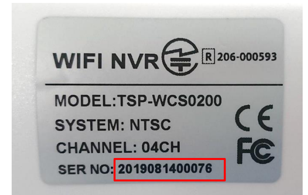
カメラセットの製造番号